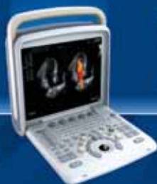
Q 6 Doppler Color