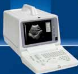
D 600 VET Digital