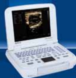
SIUI CTS 900 V