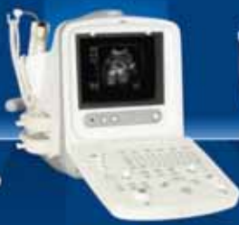
8300 VET Digital