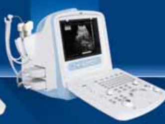
8100 VET Digital