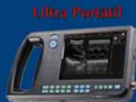
WELL D - 3000 VET